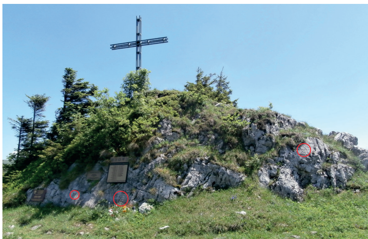
Obr. 1. Hraničné bralo medzi Kráľovou studňou a Smrekovicou s označením miesta umiestnenia hraničných znakov, foto: Oto Tomeček.