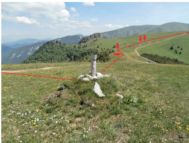
Obr. 5. Rekonštrukcia priebehu historickej hranice mesta Banská Bystrica v oblasti Kráľova studňa vo Veľkej Fatre (šípky označujú polohu vzdialenejších medzníkov – hraničných kôp a znakov), autor: Oto Tomeček.