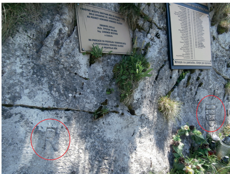
Obr. 2. Vedľa seba umiestnené hraničné znaky Révaiovského panstva a mesta Banská Bystrica na brale medzi Kráľovou studňou a Smrekovicou