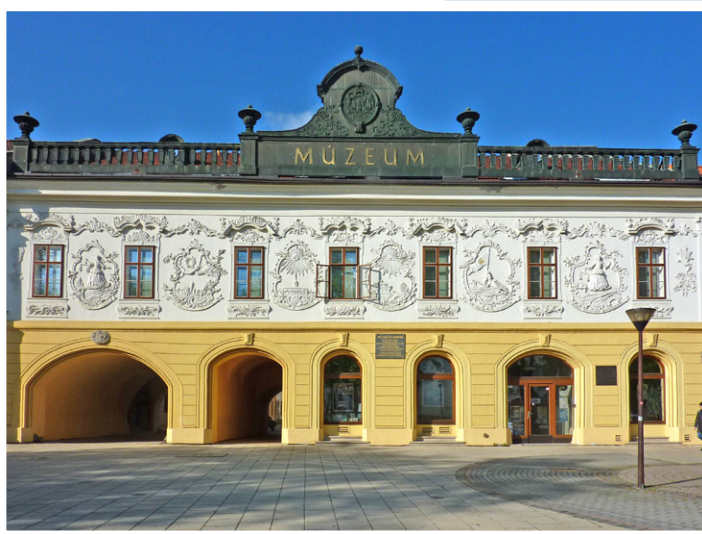
Budova Vlastivedného múzea v Spišskej Novej Vsi. Do roku 1876 bola sídlom provincie 16 spišských miest.