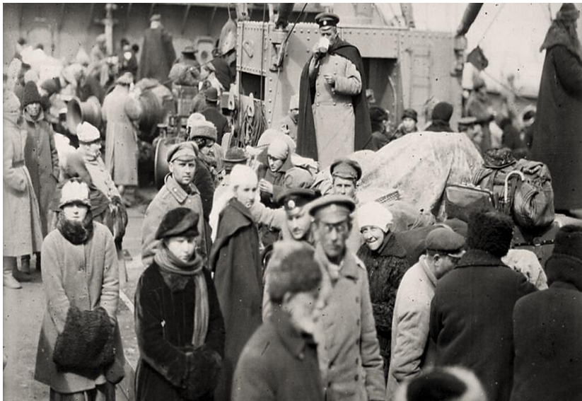
Emigranti z Ruska (1917 - 1921)