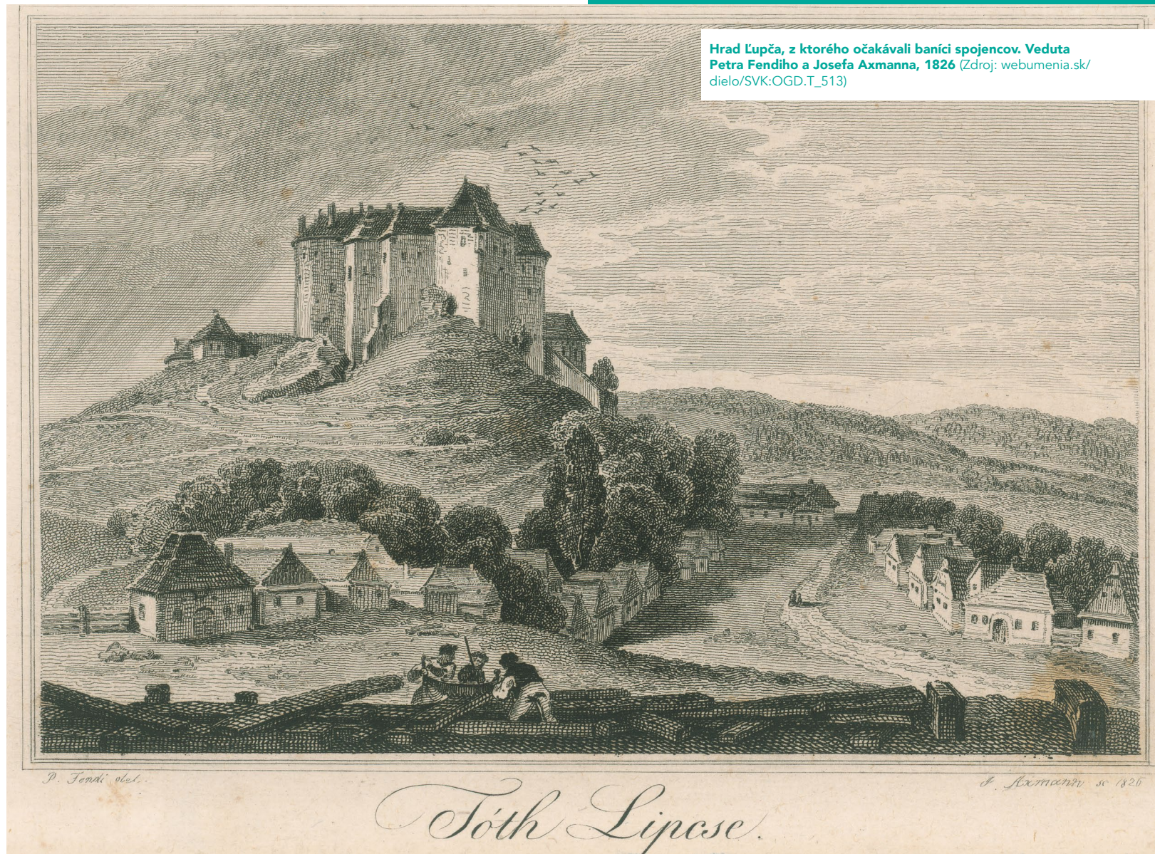
Hrad Ľupča, z ktorého očakávali baníci spojencov. Veduta Petra Fendiho a Josefa Axmanna, 1826

kastelán Zvolenského zámku a správca majetkov ostrihomského arcibiskupa vo Svätom Kríži (dnes Žiar nad Hronom). Svojich poddaných vyzbrojil aj kastelán Dobronivského hradu. V zaužívaných predstavách o stredovekej spoločnosti môžu pôsobiť paradoxne zmienky o ozbrojených roľníkoch, ktorí mali zakročiť proti baníkom. Dôvod bol jednoduchý: veľká