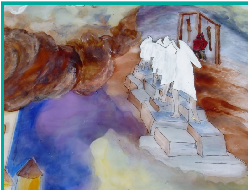
Vzbúrenci kráčajúci na popravisko. Vitráž v Kaplnke sv. Klimenta v Španej Doline. Autor Andrej Sitár

základov, pričom baníci využili neprítomnosť značnej časti šľachticov (ozbrojenej moci) v auguste 1526.