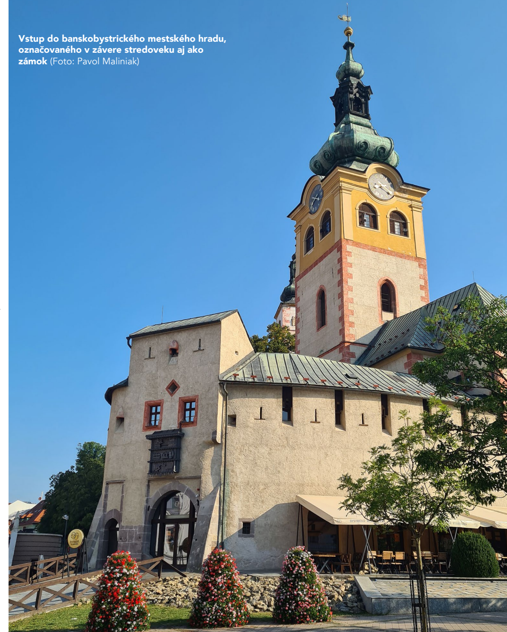
Vstup do banskobystrického mestského hradu, označovaného v závere stredoveku aj ako zámok