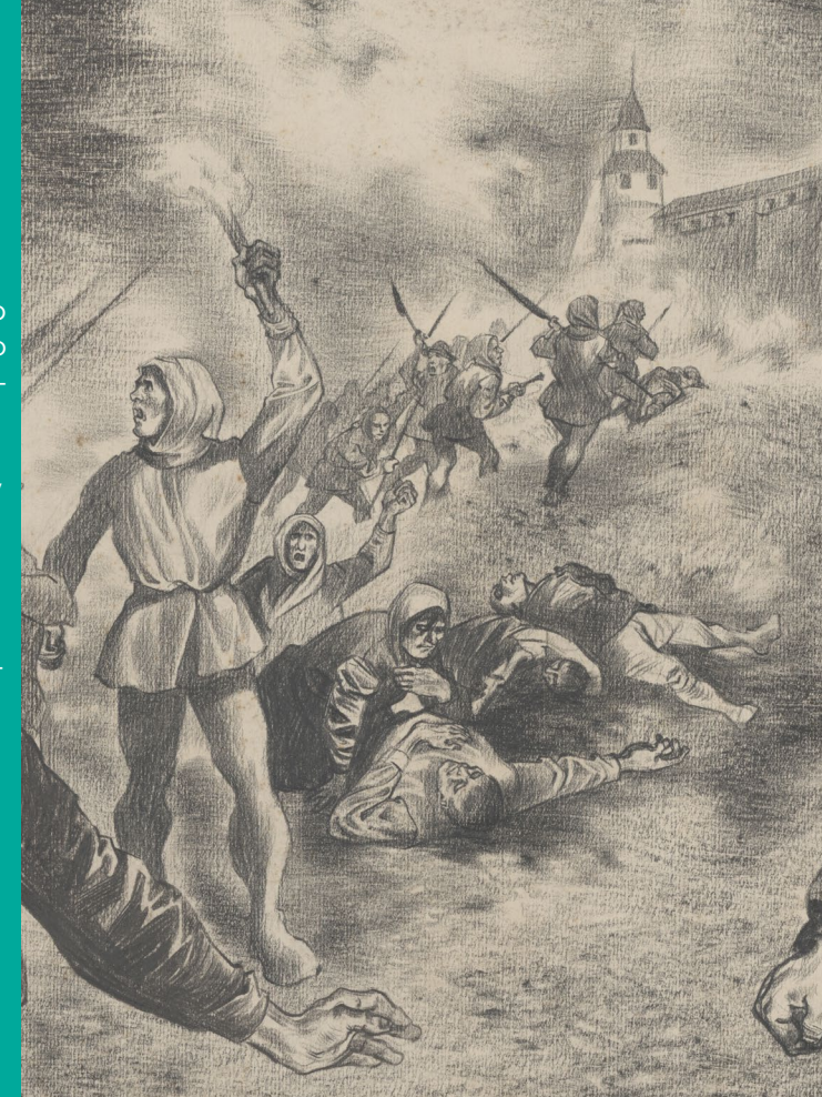
Banické povstanie roku 1526 - detail. Autor Vincent Hložník. Kresba ceruzou, 1955

Prvá etapa konfliktu sa odohrala v máji 1525. Po štrajku kvôli nízkym mzdám sa baníci zhromaždili pred Banskou Bystricou a vyjed-