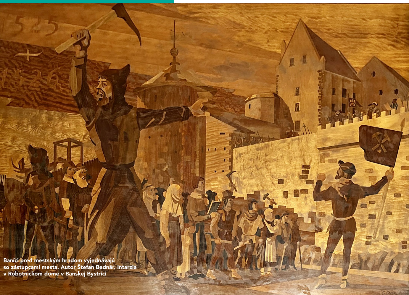
Baníci pred mestským hradom vyjednávajú so zástupcami mesta. Intarzia v Robotníckom dome v Banskej Bystrici