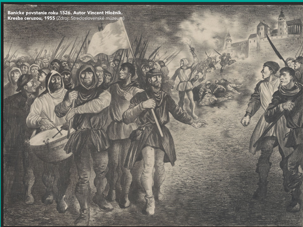
Banické povstanie roku 1526. Autor Vincent Hložník. Kresba ceruzou, 1955

Súčasníci, najmä tí skôr narodení, si môžu pamätať televízny seriál Na baňu klopajú. Výrazná generácia slovenských hercov v ňom zobrazila tragické osudy členov jednej rodiny na pozadí rebélie baníkov v Banskej Bystrici. Do popredia vystupoval útlak a spoločenský konflikt na sklonku stredoveku. Ťažké životné podmienky baníkov boli zjavnou skutočnosťou. Na rozdiel od filmového spracovania, historické pramene nevykresľujú vzbúrencov iba ako obeť. Ukazujú, že táto skupina obyvateľov dokázala vyvinúť organizovaný odpor a stala sa pre okolie reálnou hrozbou.