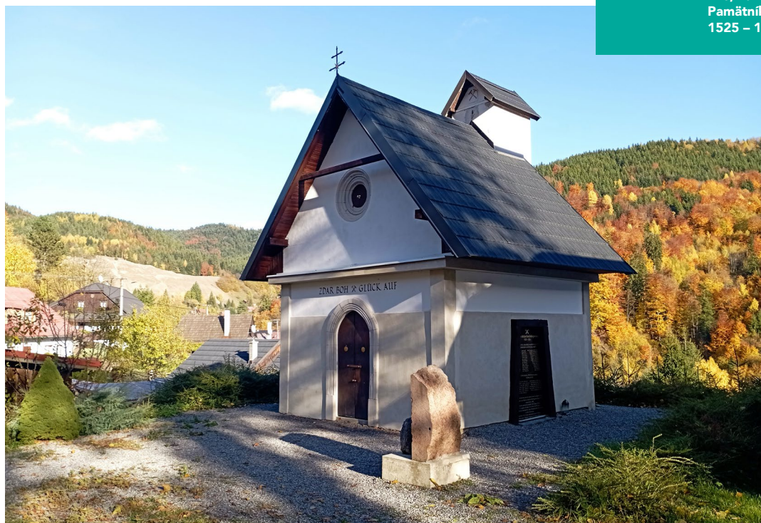
Banícka Kaplnka sv. Klimenta v Španej Doline, na ktorej je z bočnej strany osadený Pamätník obetiam banického povstania 1525 – 1526