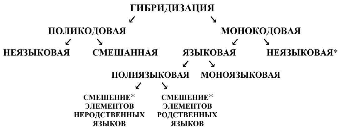
Схема 1. Модифицированная версия типологии гибридизации А. Хотног (2019, с. 192).

Многоаспектность гибридизации и разнообразие ее процессов обусловило разработку нескольких типологий в соответствии с отличными критериями (Ирисханова, 2010, с. 3; Хотног, 2019, с. 191-192). В рамках лингвосемиотических исследований, принимающих за основу критерий принадлежности знаков к разным или к одной семиотической системе, выделяются поликодовый и монокодовый типы гибридизации. Если в определении поликодового типа учитываются неязыковые знаки, то монокодовость сводится к языковым знакам, причем без учета критерия (не)родственности языков, что важно (Поливанов, 1991, с. 353-354) 12 . Поэтому дополнение типологии, предложенной Анастасией Хотног, представляется обоснованным (добавленные элементы отмечены звездочкой):