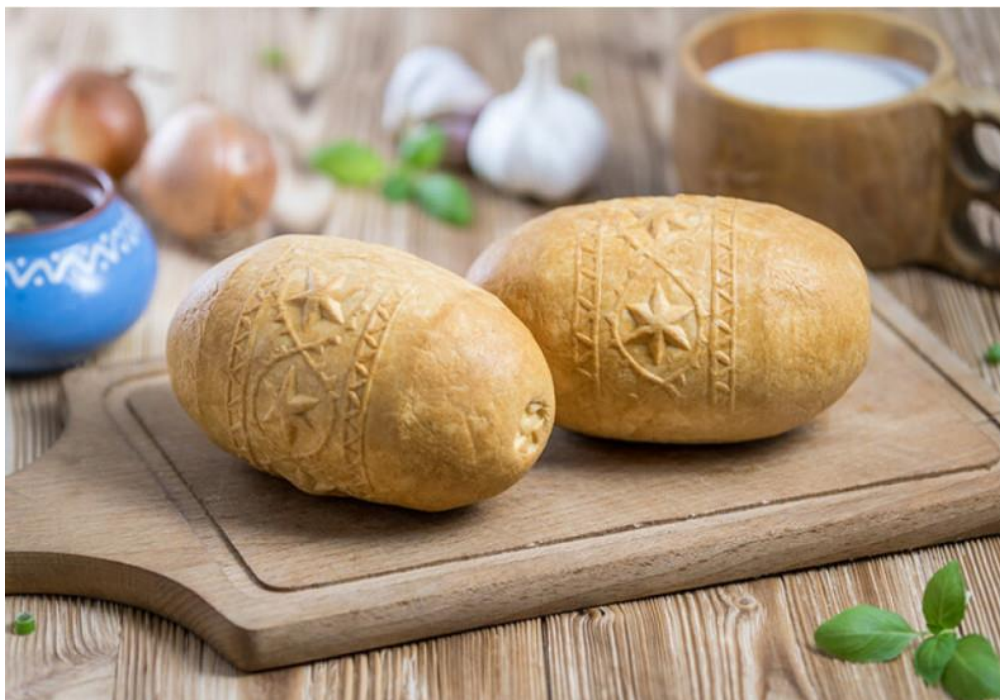
Obrázok č. 1: Slovenský ostiepok

napr. vtáky, srdiečka ap.). ASJ IV (1984) a VS (2002) spracovávajú len heslá štiepky (ASJ) a oščipac (VS).