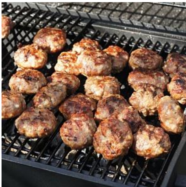
Obrázok č. 3: Leskovački uštipak/Лесковачки уштипак