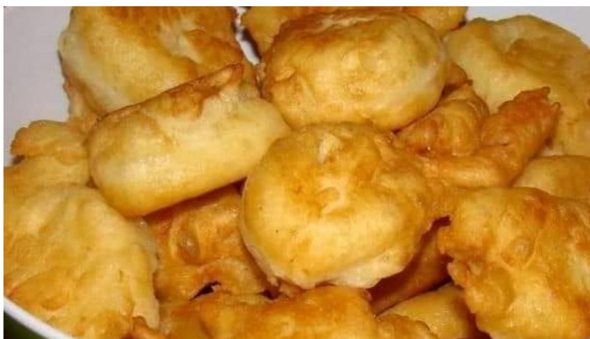
Obrázok č. 2: Uštipak/uštinak

V srbskom a chorvátskom jazyku sme našli sloveso štipati s významom štípať v etymologickom slovníku od autora Skoka (1971, s. 414). V srbskom jazyku uštipak neoznačuje syr, ale je to druh chleba, akési pečivo, ktoré sa zvyčajne konzumuje na raňajky. Pripravuje sa na veľkom množstve oleja (obrázok č. 2). Jestvuje aj jedlo s názvom Leskovački uštipak /Лесковачки уштипак (obrázok č. 3) ( uštipak z Leskovca 47 ), čo je mäsové jedlo pripravené z mletého mäsa a papriky. Obe spomínané jedlá sa pripravujú tak, že sa cesto, resp. mäso, vyvalká do kruhového tvaru, ktorý pripomína syr.